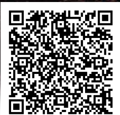
QRコードから動画で製品紹介