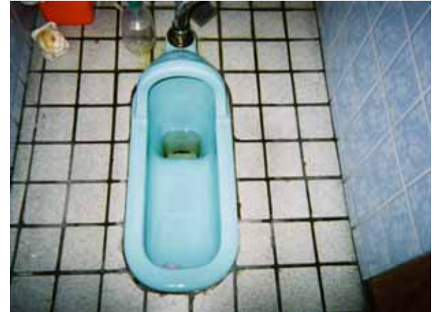
トイレコート剤施工