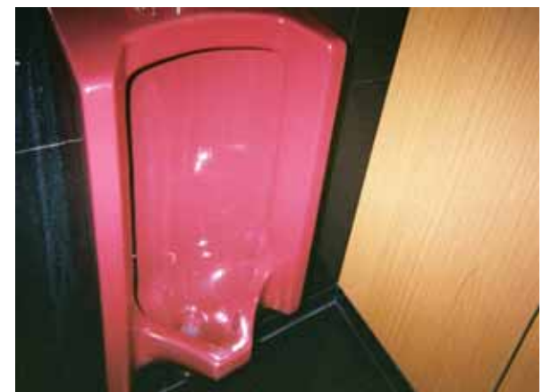
トイレコート剤施工