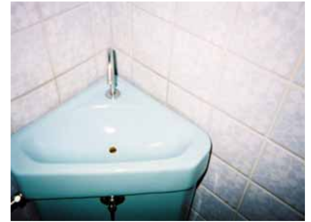
トイレコート剤施工