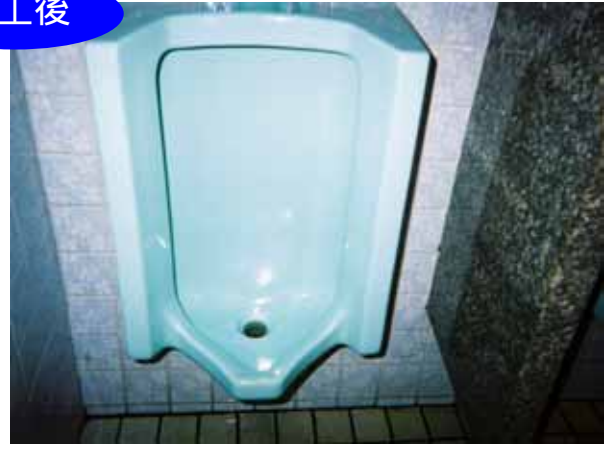
トイレコート剤施工