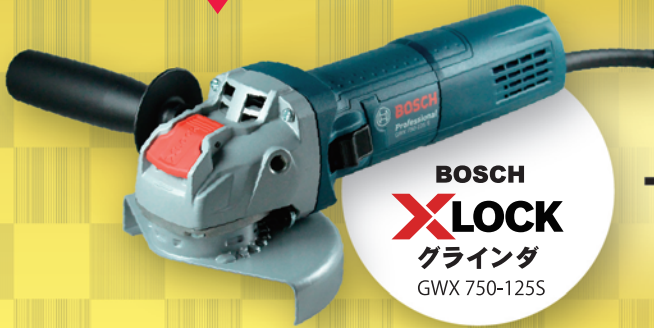
BOSCH X-LOCK グラインダ GWX 750-125S