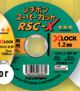
RESIBON X-LOCK 専用といし